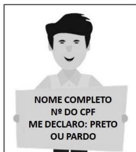
Figura 3. Modelo de Autodeclaração para o vídeo.